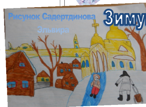
Рисунок Садертдинова Эльвира